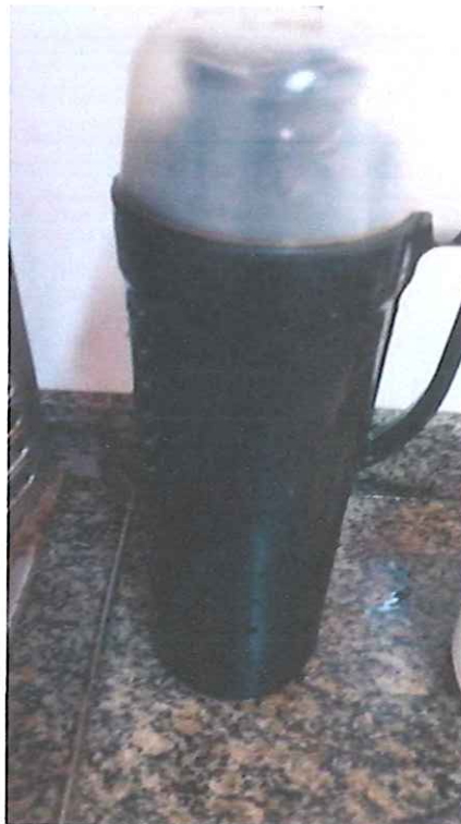
Garrafa térmica comprada em Janeiro

EMPRESA: IPCEP TERMO DE COLABORAÇÃO: 04/2020